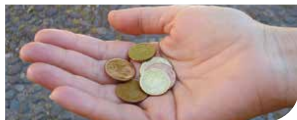
Um Almosen bitten ist ein Menschenrecht

Die Unsicherheit, ob ein Almosen wirklich sinnvoll ist, lässt sich nie ganz ausräumen. Lassen Sie daher Ihr Herz sprechen. Sie allein entscheiden, ob und wie Sie helfen wollen.