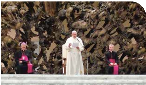
In seiner Rede forderte der Papst die ACLI auf, Motor einer „neuen Allianz gegen die Armut“ zu sein und dazu beitragen, Vorschläge für die Garantie menschenwürdiger Arbeit zu machen.