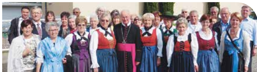
Die Wallfahrer aus Südtirol in Weingarten.

Zeichen der Begegnung, der Fröhlichkeit, der Erinnerung, des Zuspruchs und der Dankbarkeit stehen, so Untergaßmair in der Begrüßung. Er selbst hat 35 Jahre in Deutschland verbracht und sagte: „ich bin glücklich und freue mich, diesen Gottesdienst feiern zu dürfen“. In den Fürbitten wurde auch jener gedacht, die heute ihre Heimat verlassen müssen und auf der Flucht sind. Nach der Messe in der Basilika trafen sich die Wallfahrer im Kongresszentrum von Weingarten zu einem gemeinsamen Mittagessen und gemütlichem Beisammensein. ▽