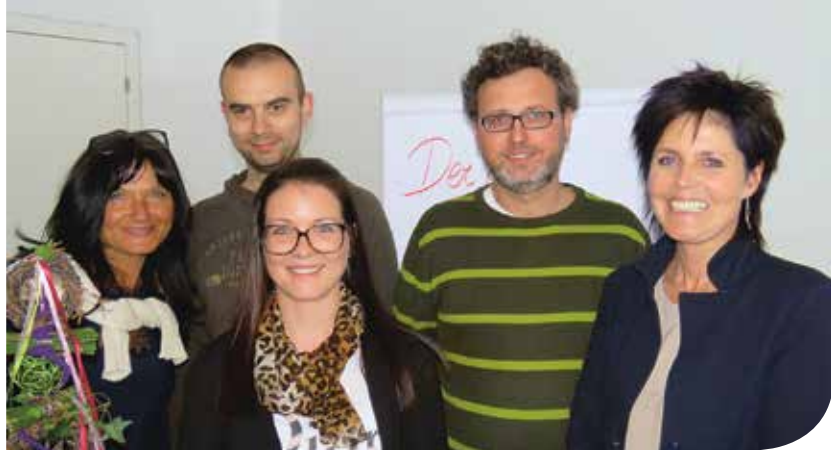
Der neu gewählte KVV Ortsausschuss von Percha