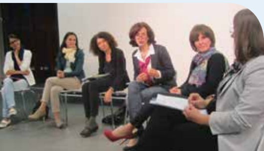
36 Mitglieder wurden geehrt.