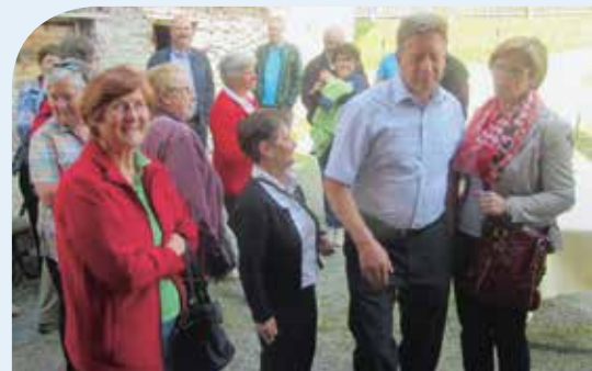
Treffen der Ehrenamtlichen aus dem Sarntal und Wipptal